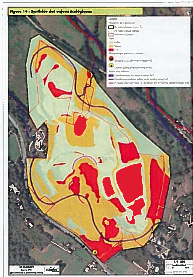
Cartographie de synthèse des enjeux – milieu naturel